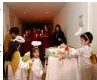
病棟をまわる天使たち